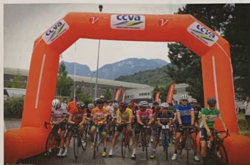
Près de 150 participants seront au départ de la course à Moûtiers.

Le tour de Tarentaise, nouvelle version, présente des étapes volontairement plus courtes afin que tous puissent y participer. Le mercredi 31 juillet, il débute par un contre-la-montre à Moûtiers, en semi-nocturne. Partenaire depuis le début, la ville « nous fait confiance ». Grâce à l'appui important du conseiller régional Fabrice Pannekoucke, l'événement est à présent soutenu par la région Auvergne Rhône Alpes. Comme toutes les courses cyclistes qui animent la ville, le tour de Tarentaise fait partie des rendez-vous très attendus. Dès 18h, place de la Libération, ce sera une belle fête animée en musique, avant le départ à 19h15, pour un circuit bouclé de 3,2 km. Les étapes suivantes sont des courses en ligne.